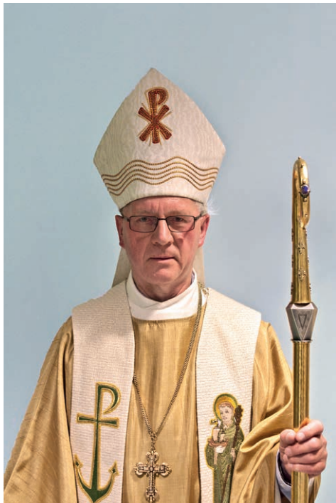
© Korneel Boeve, uit het boek 'Schatten van de Duinenabdij' (2012)

Ten Duinen (België – Vlaanderen) : Rust in vrede, abt Leo