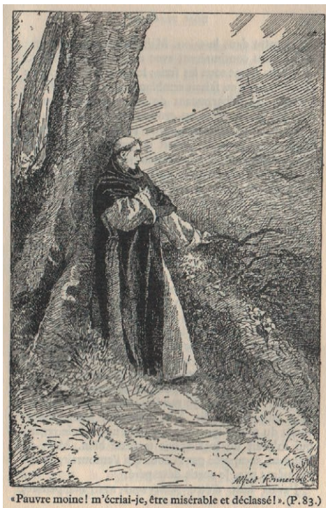
« Pauvre moine ! m'écriai-je, être misérable et déclassé ! ». (P. 83.)

Villers (Belgique – Wallonie) : réédition de « Dom Placide »