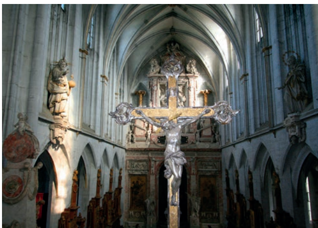
Villers (Belgique – Wallonie) : Jazz manouche