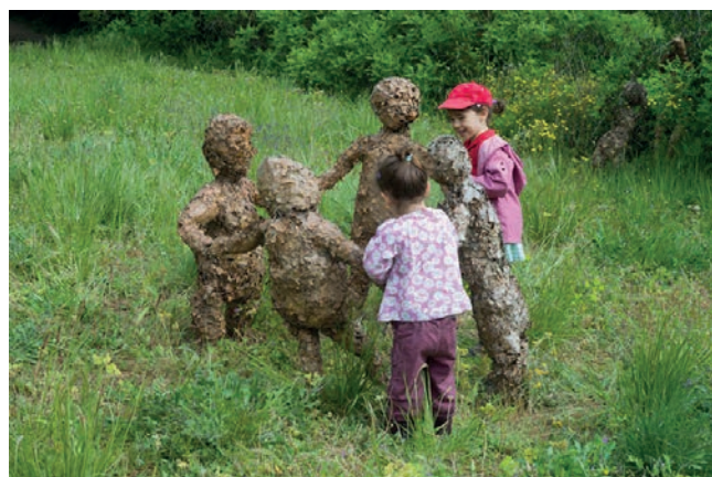
Les Pheillus

Noirlac (France – Centre-Val-de-Loire) : Rendez-vous au jardin