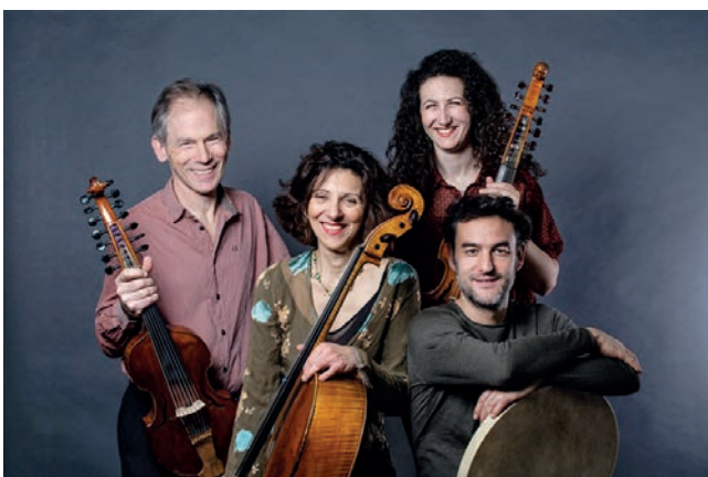
Noirlac Matinale du 15 avril

Noirlac (France – Centre-Val-de-Loire) : Matinale