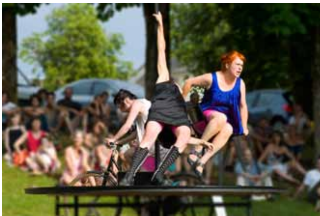
Théâtre par la Compagnie Les yeux d'Encre

tistiques convergent lors de ce week-end festif. Tous ces projets, construits avec de nombreux partenaires éducatifs, sociaux et culturels pendant plusieurs mois, marquent la richesse et la vitalité du territoire. Le temps a décidé de s'arrêter sur les bords du Cher pour vous permettre de découvrir les productions de 450 artistes amateurs, 18 équipes artistiques professionnelles, mais aussi de déguster quelques spécialités culinaires sous les arbres de Noirlac.