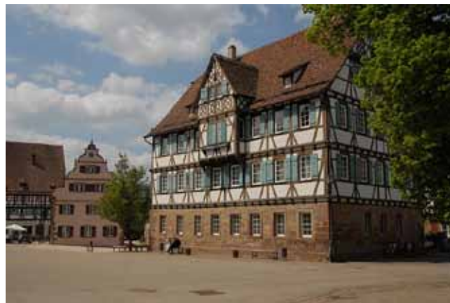
Photo Kloster Maulbronn