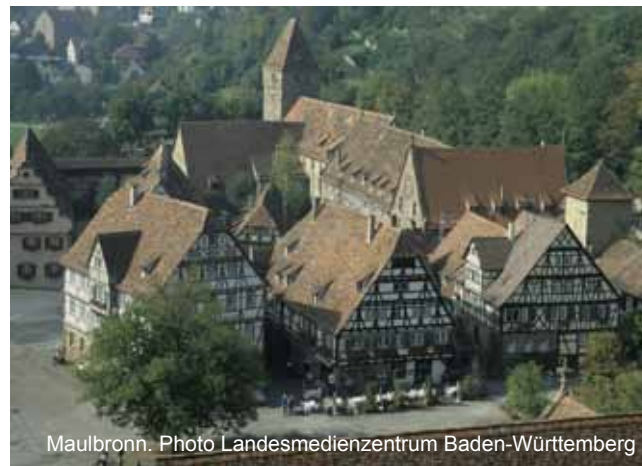
Maulbronn.