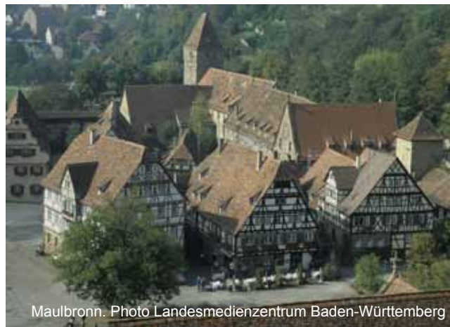
Maulbronn.