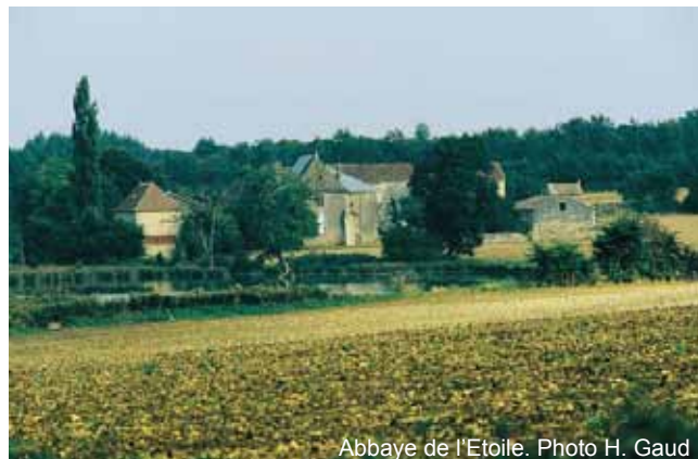
Abbaye de l'Etoile.