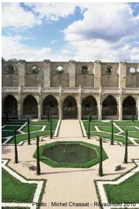
Royaumont 2010

Royaumont (France – Île-de-France) : la fin des travaux de restauration du cloître