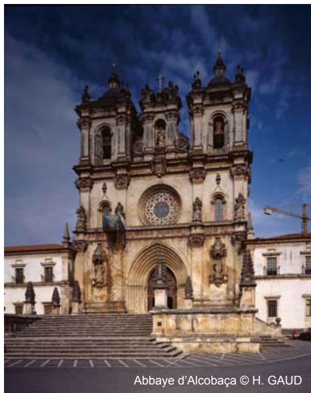
Abbaye d'Alcobaça

This ambition must start within our own organization. The printed newsletter, published 2 or 3 times a year since our foundation and sent to all members, has contributed to create the spirit of the Charter. But it has remained too confidential for all those who take an active part in our day-to-day actions. One example tells it all. A guide from a member abbey has found out by chance our exhibition stand at the Salon du Patrimoine and has learnt that we organized a training course in Cîteaux ! Hence the launching of this online newsletter which thanks to the globalization of Internet should reach as many people inside the Charter and beyond as possible.