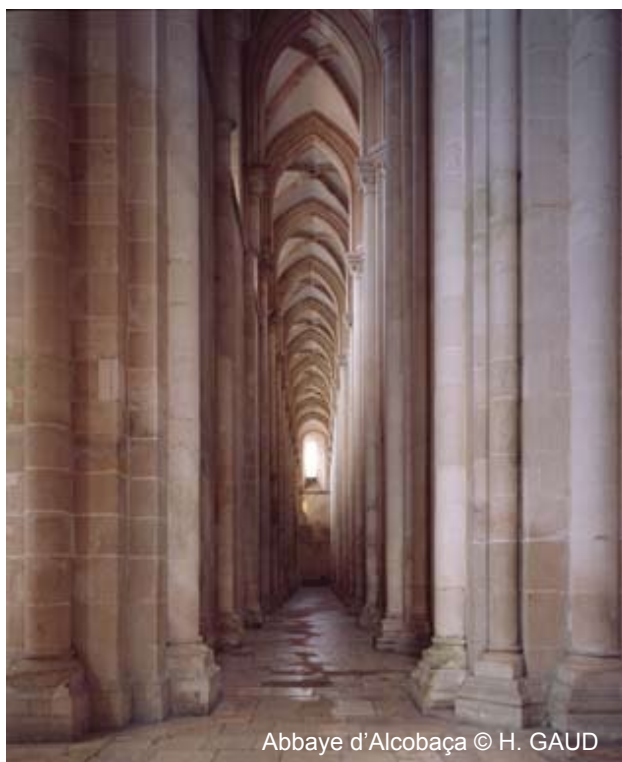
Abbaye d'Alcobaça

Yet, beyond the solidarity that has been created between its members, the action of the Charter remains too often unrecognized by the local authorities, the scientific community and the media. We have been a major actor in "Cîteaux 98". We are members of Europa nostra. The French Ministry of Culture has helped us to set up our Europeans forums. But we need to give more weight to the 2-millions visitors or so who each year visit our sites or take part in our concerts, our seminars. Communication must become the prevalent challenge in the actions of the Charter.