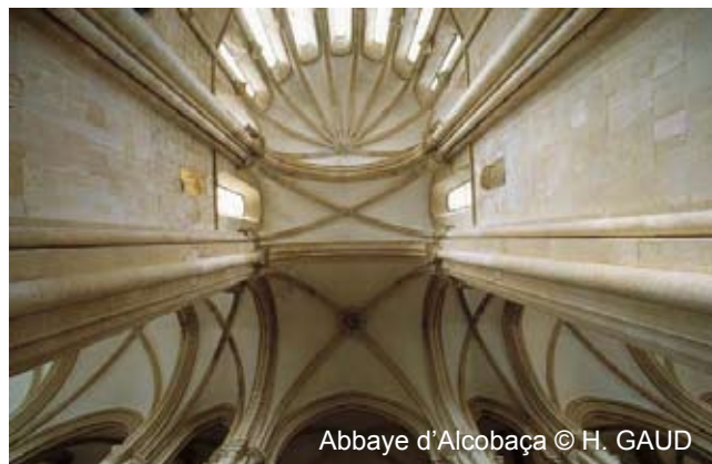
Abbaye d'Alcobaça

The cost of this travel (flight + hotel) is 322 € in double room - 360 € in single. If you are interested, please contact the travel agency : Rheintourist Reisebüro ( www.rheintourist.com ) – Bahnhofstrasse 4a – D 53604 Ban Honnef – Tél 02224-93890 Fax 02224 – 938950 – info@rheintourist.com